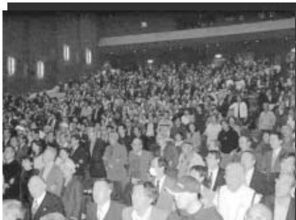
IBMのリストラは彼岸の火事ではない」と集まった大会場を埋め尽くす1300人の観衆と熱気

当日は、関西、愛知、長野などからもIBMの組合員をはじめ、支援労組の組合員、争議団が駆けつけ、1,300人で会場がいっぱいになる大盛況でした。