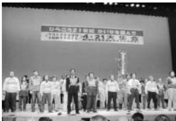
滋賀県労連辻議長による閉会の挨拶